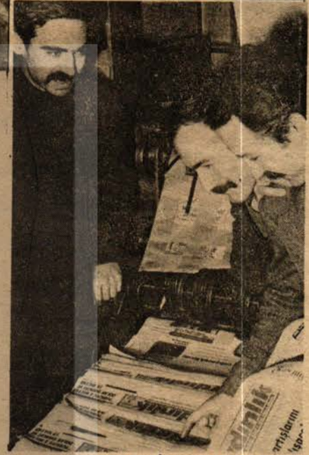
AYDINLIK'IN İLK SAYILARI