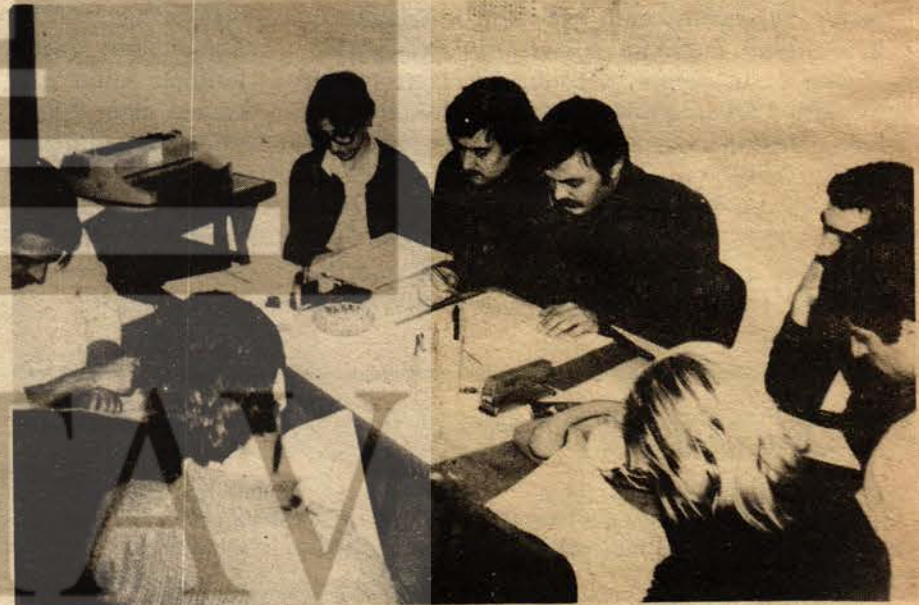
Avrupa muhabirlerimiz Frankfurt Merkez Büromuzda toplantı halinde

Sabahları saat 8.00'de büromuz çalışanları işe başlıyor. Önce günlük gazeteler okunuyor. Her gün Türkçe gazeteleri ve ayrıca belli başlı Almanca gazeteleri izliyoruz. Alman gazetelerindeki en önemli haberler seçildikten sonra, tercüme işini yüklenen arkadaş tarafından tercüme ediliyor. Merkezi muhabirimiz ise, o günkü olaylar zincirinin en önemli halkasını izlemekle yükümlü. Örneğin bir grev, önemli bir ziyaret veya olay. Öğleden sonra büro dışındaki ilişkilere ayrıldı.